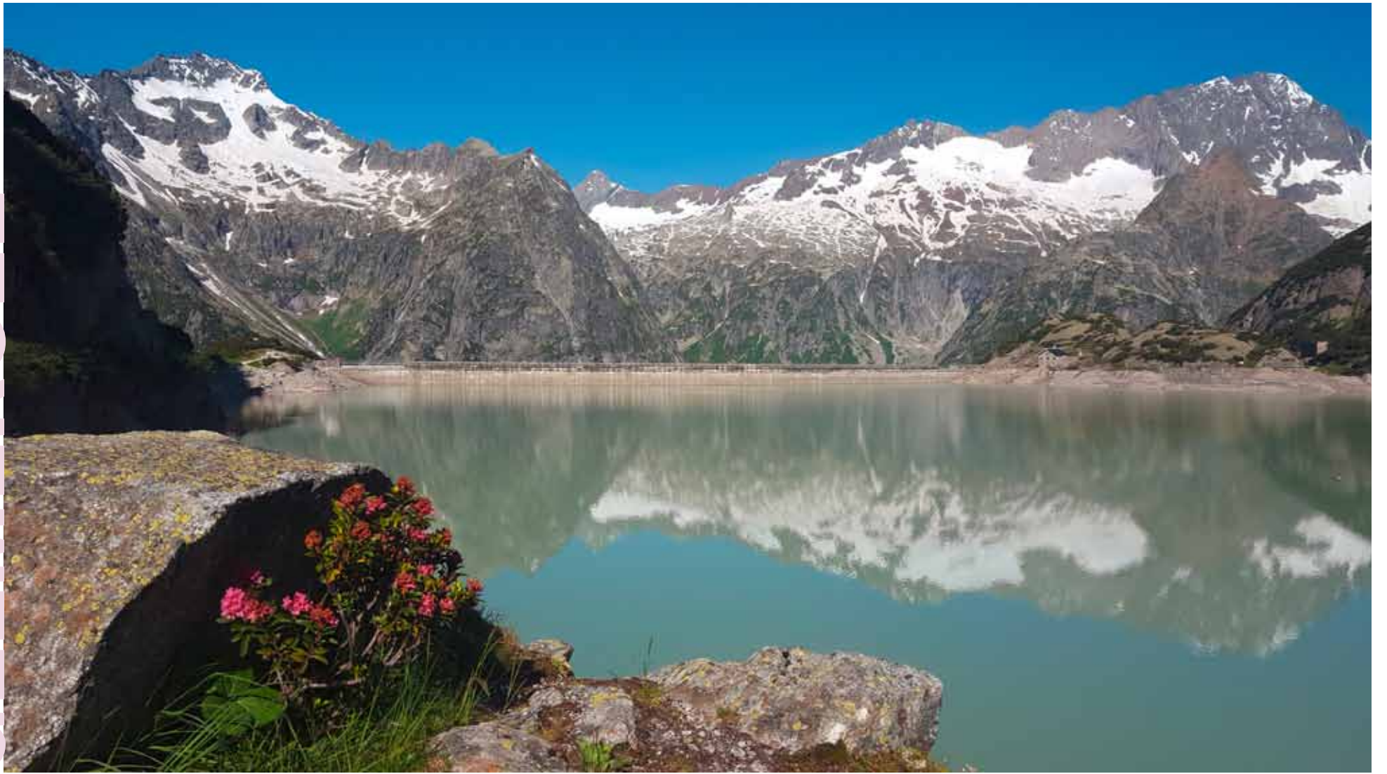
BILDER GELMER- UND BRIENZERSEE VON HEIDI SIMON